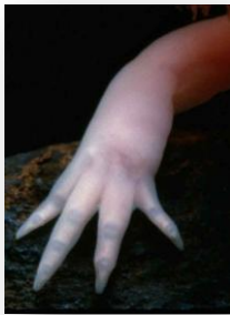
Pattes avant dotée de 4 doigts

Il possédé également une tête relativement grosse par rapport a son corps avec des petit yeux de couleur noir.